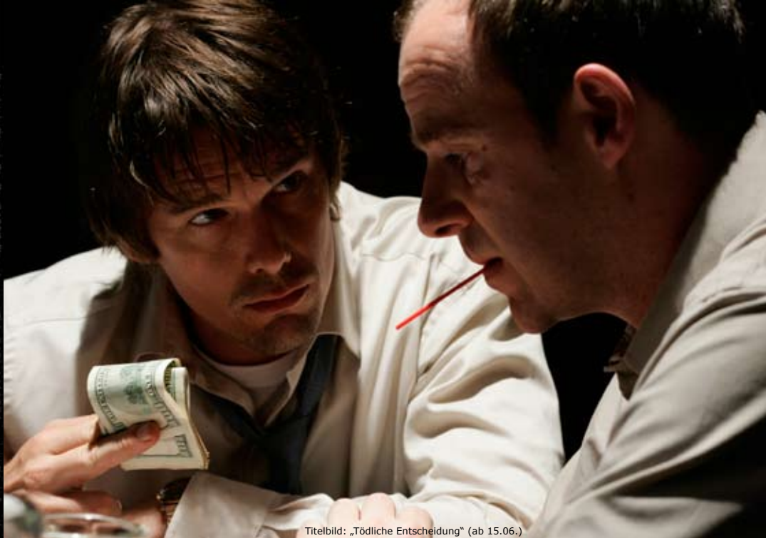
Titelbild: „Tödliche Entscheidung“ (ab 15.06.)

Friedrich-Ebert-Str. 2, 24937 Flensburg - Tel. 0461 1411814 - www.51stufen.de