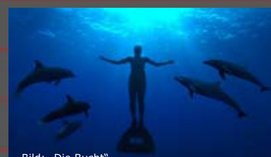
Bild: „Die Bucht“