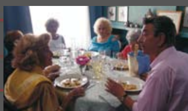
Bild: „Das Festmahl im August“