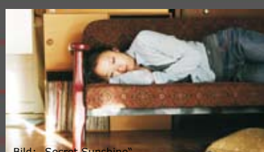
Bild: „Secret Sunshine“

Als Shin-aes Mann stirbt zieht sie mit ihrem Sohn Jun weg aus Seoul in die Kleinstadt Mi-lyang. Sie versucht dort Fuß zu fassen, was ihr aber nicht gelingt. Sie fühlt sich einsam und fremd. Der Junggeselle Jong ist der Einzige, der gerne in ihrer Nähe ist. Doch eines Tages wird Jun kaltblütig ermordet. Shin-ae ist verzweifelt und sucht bei ihren gläubigen Nachbarn und Gott Trost. Doch ihre Zweifel und ihre Wut sind stärker als der Glaube. Lee Chang-dong zählt zu den bekanntesten und international erfolgreichsten Regisseuren Südkoreas. Ihm gelingt hier ein tiefer Blick in eine verwundete Seele und die ergreifende Bebilderung der inneren Tour de Force einer einsam Trauernden.