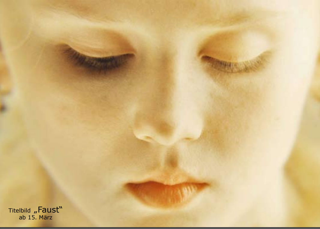
Titelbild „Faust“ ab 15. März

Friedrich-Ebert-Str. 7 - 24937 Flensburg - Tel. 0461 1411884 - www.51stufen.de