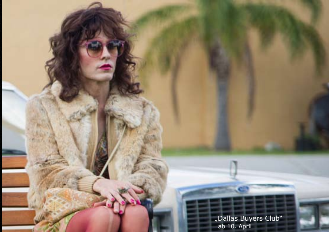
„Dallas Buyers Club“ ab 10. April

Friedrich-Ebert-Str. 7 - 24937 Flensburg - Tel.: 0461 31802 184 - www.51stufen.de