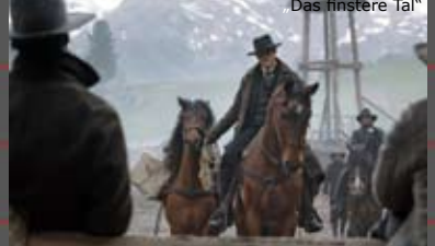
„Das finstere Tal“

Drama/Erotik von Lars von Trier, mit Stellan Skarsgård, D/DK/F/S 2014, 124 Min, ab 18J In Nymphomaniac 2 wird die selbsterklärte Nymphomantin Joe an einem kalten Winterabend von Seligman, einem alten Junggesellen, bewusstlos und zusammengeschlagen in einer Seitenstrasse aufgefunden. Er bringt sie in seine Wohnung, betrachtet sich ihre Wunden und versucht zu verstehen, was bei ihr schiefgelaufen sein könnte. Er beschließt, die Fremde in seiner Wohnung gesund zu pflegen. Während des Heilungsprozesses erzählt ihm die 50-jährige Frau in acht Kapiteln aus ihrem reichen Schatz an sexuellen Erfahrungen – und zwar äußerst detailgenau. Zweiter Teil des Porno-Dramas von Lars von Trier.