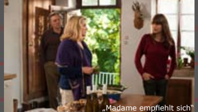
„Madame empfiehlt sich“

Drama/Komödie von Stephen Frears, mit Judi Dench, GB 2013, 98 Min, ab 6J Philomena Lee ist eine resolute, lebenslustige Frau aus einfachen, irischen Verhältnissen. Am 50. Geburtstag ihres Sohnes offenbart sie ihrer Tochter ein lang gehütetes Geheimnis. Als junges Mädchen bekam sie ein Baby. Die Nonnen, in deren Obhut ihr Vater sie abgeschoben hatte, zwangen sie, es zur Adoption freizugeben. Ihr größter Wunsch ist es, zu wissen, ob er ein gutes Leben führt. Philomenas Tochter bittet den zynischen Fernsehjournalisten Martin Sixsmith, ihrer Mutter bei der Suche nach dem verlorenen Sohn zu helfen. Regisseur Stephen Frears kehrt mit dieser ebenso herzerfrischenden wie -ergreifenden Tragikomödie zur Hochform von „Die Queen“ zurück.