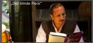
„Der blinde Fleck“

Drama/Erotik von Lars von Trier, mit Charlotte Gainsbourg D/DK/F/S 2013, 118 Min, ab 18J Erotik-Drama mit expliziten Szenen um eine Nymphomantin.