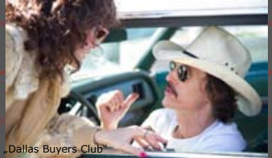
„Dallas Buyers Club“