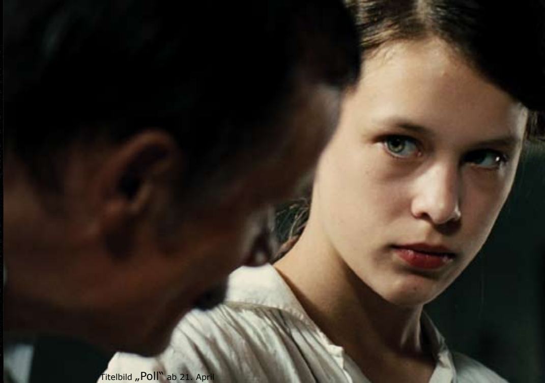
Titelbild „Poll“ ab 21. April