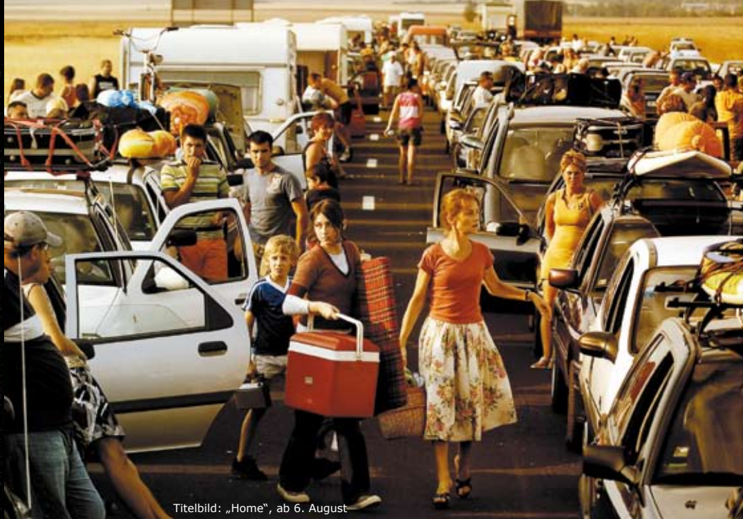
Titelbild: „Home“, ab 6. August

Friedrich-Ebert-Str. 7 · 24937 Flensburg · Tel. 0461 1411814 · www.51stufen.de