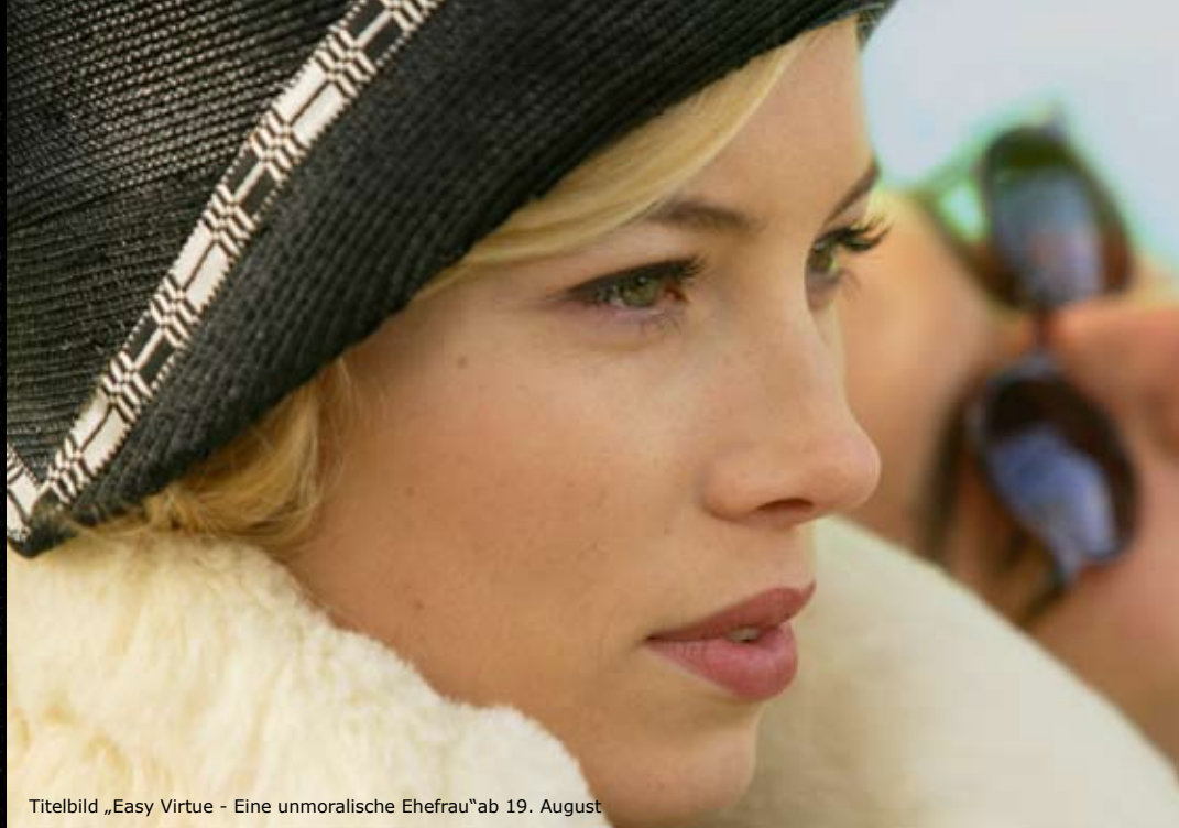
Titelbild „Easy Virtue - Eine unmoralische Ehefrau“ ab 19. August

Friedrich-Ebert-Str. 7 · 24937 Flensburg · Tel. 0461 141184 · www.51stufen.de