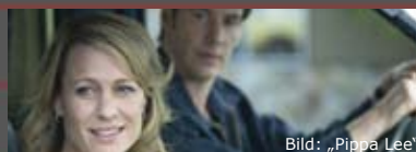
Bild: „Pippa Lee“

Drama von Rebecca Miller mit Robin Wright Penn USA 2009, 98 Min