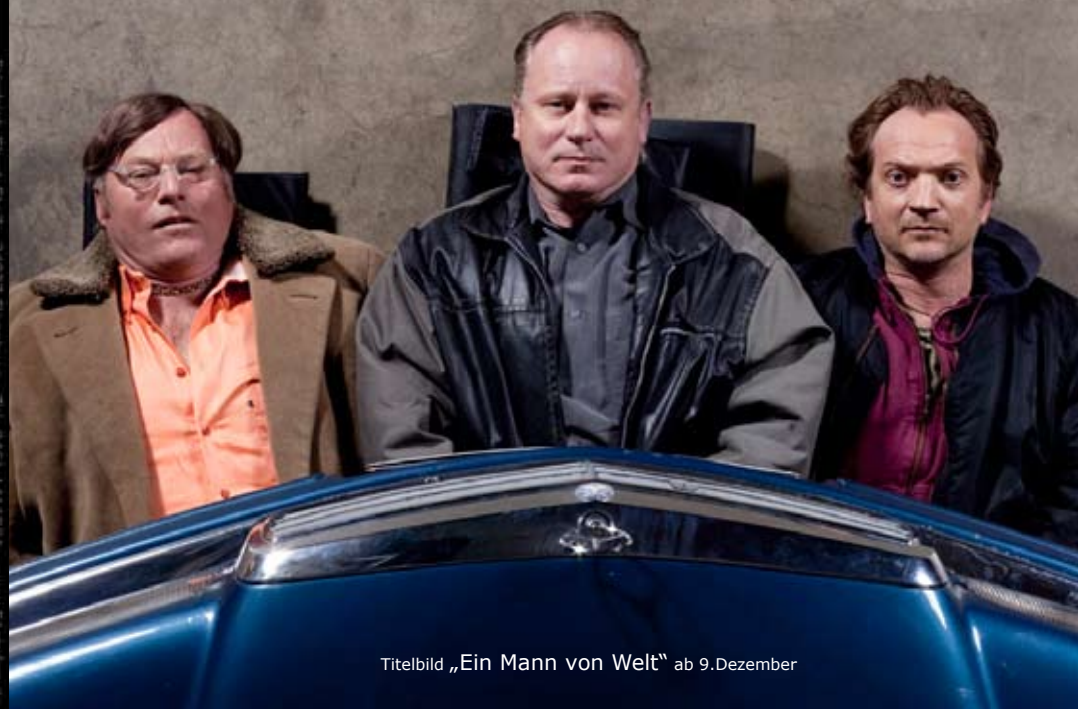
Titelbild „Ein Mann von Welt“ ab 9. Dezember

Friedrich-Ehrent-Straße 7 • 24937 Flensburg • Tel. 0461 1411814 • www.51stufen.de