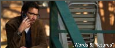
„Words & Pictures“