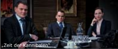
„Zeit der Kannibalen“