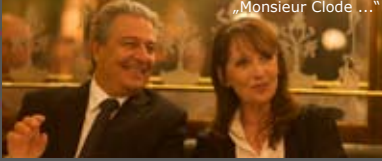
„Monsieur Claude ...“