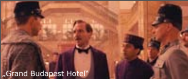
„Grand Budapest Hotel“

Komödie von Johannes Naber, mit Katharina Schüttler, D 2014, 97 Min, ab 12J. Drei skrupellose Unternehmensberater, zwei Männer und eine Frau, jetten um den Globus, machen in der so genannten Dritten Welt ihre obskuren Geschäfte. Wie Zombies streifen sie durch klimatisierte Suiten, Lounges und Konferenzräume in den immer gleichen Hotelketten. Als sie erfahren, dass ein Konkurrent in den Firmenolymp aufgestiegen ist, liegen die Nerven blank, wachsen die Neurosen, beginnt die „Zeit der Kannibalen“. Während sie noch eifrig eine Strategie für die Zukunft entwickeln, gibt es diese schon gar nicht mehr. Bitterböse Komödie, überaus sehenswert.