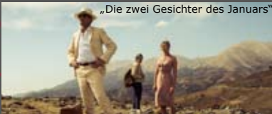
„Die zwei Gesichter des Januars“