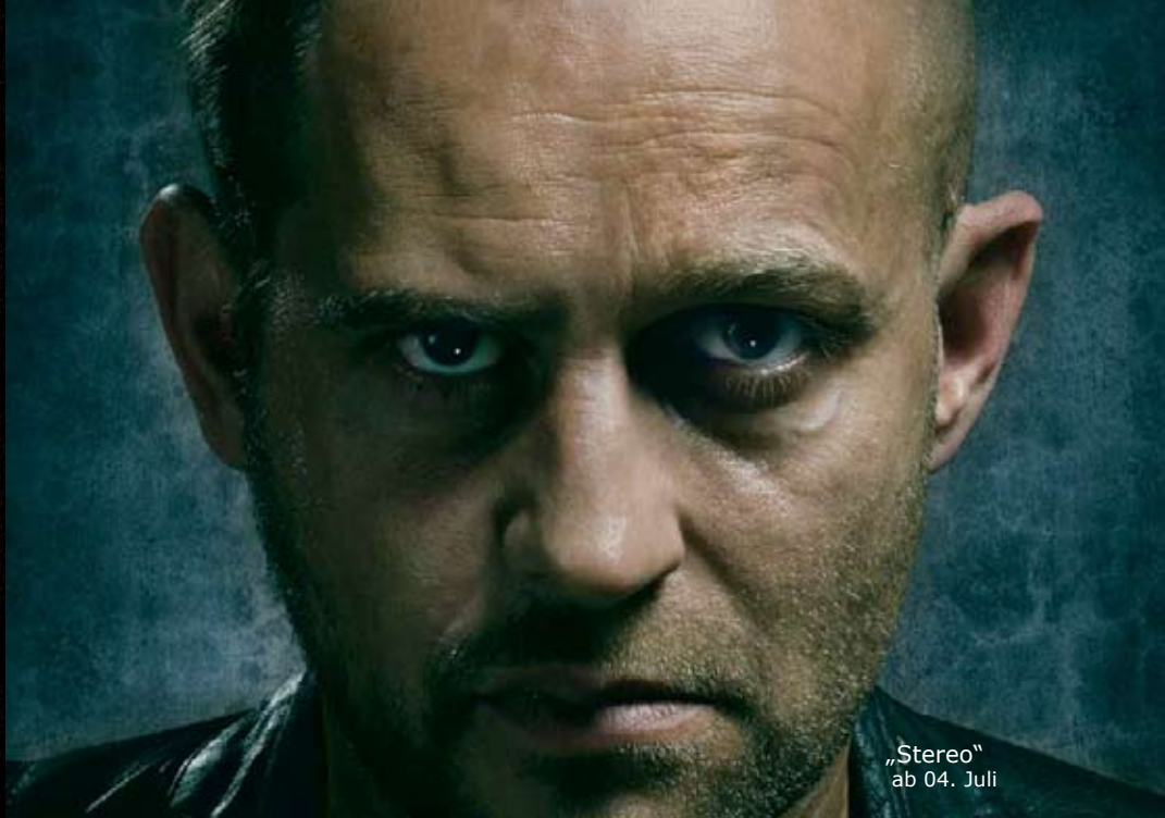
„Stereo“ ab 04. Juli

Friedrich-Ebert-Str. 7 - 24937 Flensburg - Tel. 0461 31802 184 - www.51stufen.de