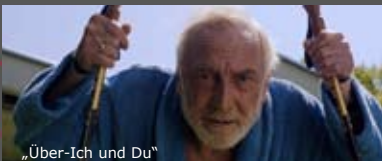
„Über-Ich und Du“